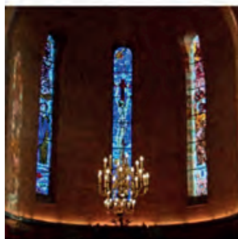
Winssen - Antonius van Paduakirche