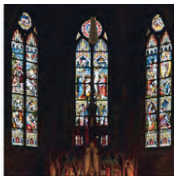
Weurt - Andreaskirche