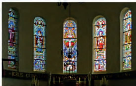
Ewijk - Johannes de Doperkerk