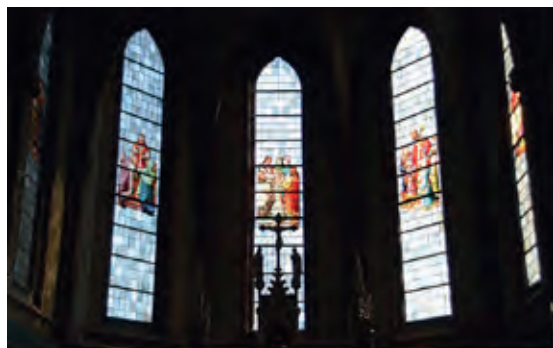
Beuningen - Corneliuskirche