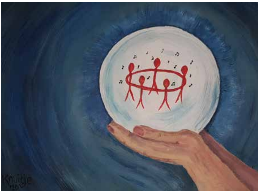
Tekening en tekst Anita Fuchten.

Nu doet het nog even pijn, maar morgen zal het beter zijn. Dan loopt iedereen weer hand in hand.